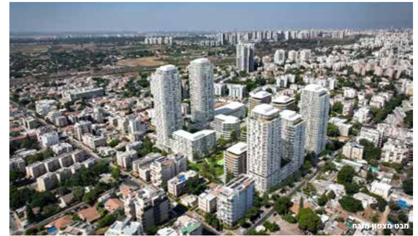
מבט מצפון מזרח