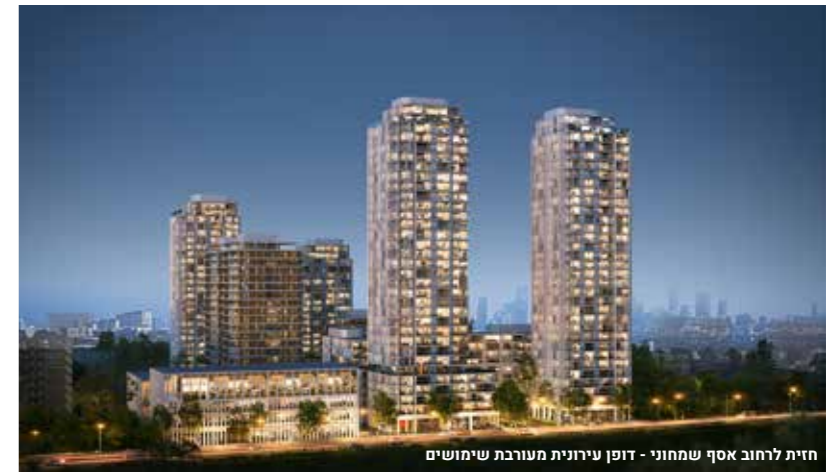
חזית לרחוב אסף שמחוני - דופן עירונית מעורבת שימושים