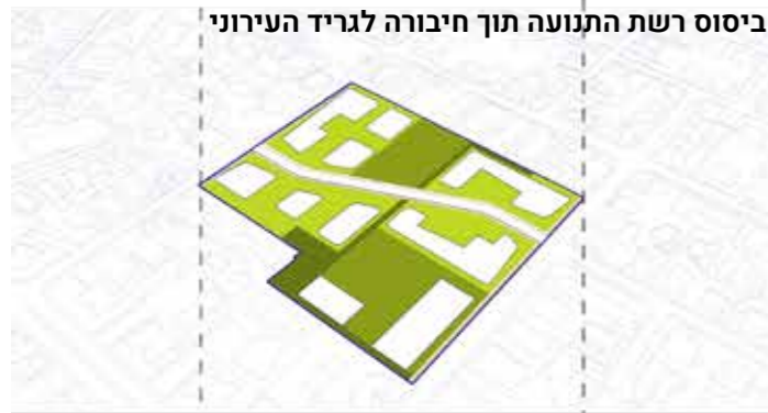
ביסוס רשת התנועה תוך חיבורה לגריד העירוני