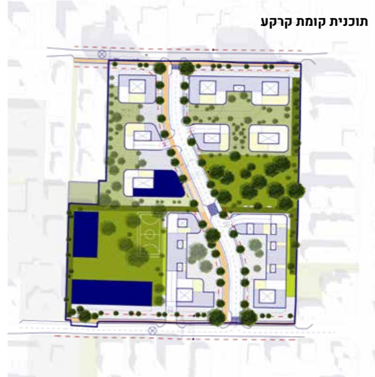
תוכנית קומת קרקע

האוכלוסיה הקיימת במתחם מגוונת ומתחלקת בין משפחות מרקע דתי, אוכלוסיה מבוגרת ילידת המקום ומזוגות צעירים בתחילת דרכם. כמענה לייחוד זה הפרויקט מציעה תמהיל מגוון של בינוי כמו גם יחידות דיור. הבינוי מורכב ממספר מגדלים הממוקמים על הצירים עירוניים ראשיים, ובניה מרקמית הממוקמת בלב המתחם כדי לשמור על הצביון הקהילתי של השכונה החדשה. מיקום המגדלים התחשב גם בנתוני ההצללה והאקלים ודאג שהשטחים הפתוחים והבינוי המרקמי יוצללו כמה שפחות.