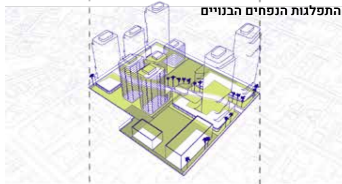
התפלגות הנפחים הבנויים