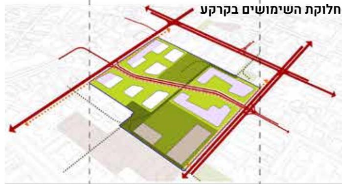
חלוקת השימושים בקרקע