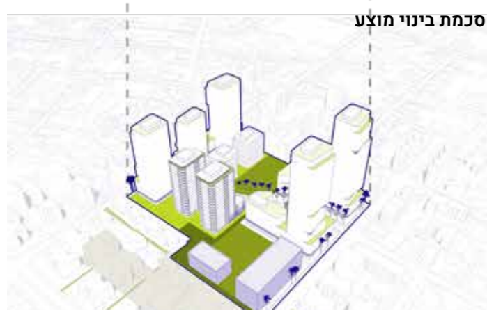
סכמת בינוי מוצע