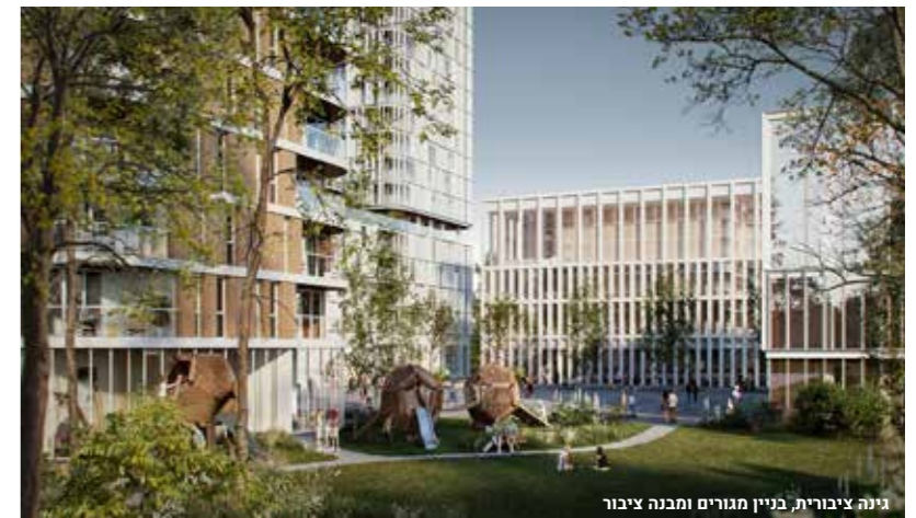
גינה ציבורית, בניין מגורים ומבנה ציבור