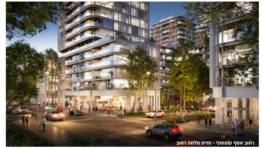
רחוב אסף שמחוני - חזית מלווה רחוב